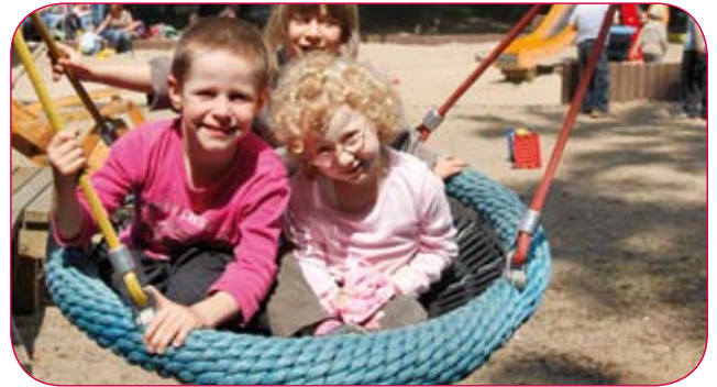
■ Heilpädagogische Kindertagesstätte und Frühförderung