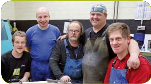
■ Werkstätten für Menschen mit Behinderung