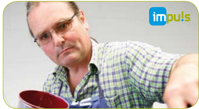
■ Werkstätten für Menschen mit psychischen Erkrankungen